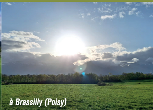
à Brassilly (Poisy)