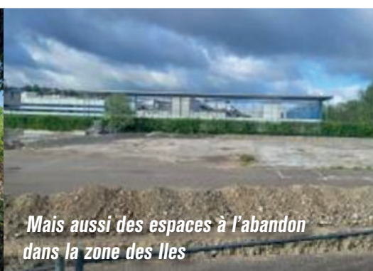
Mais aussi des espaces à l'abandon dans la zone des Iles