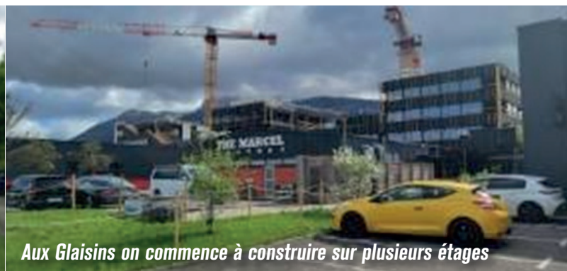
Aux Glaisins on commence à construire sur plusieurs étages

En construisant sur plusieurs étages, il serait possible de disposer de beaucoup plus de surfaces pour les activités industrielles et tertiaires !