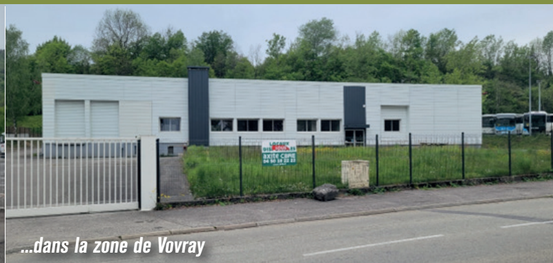
...dans la zone de Vovray