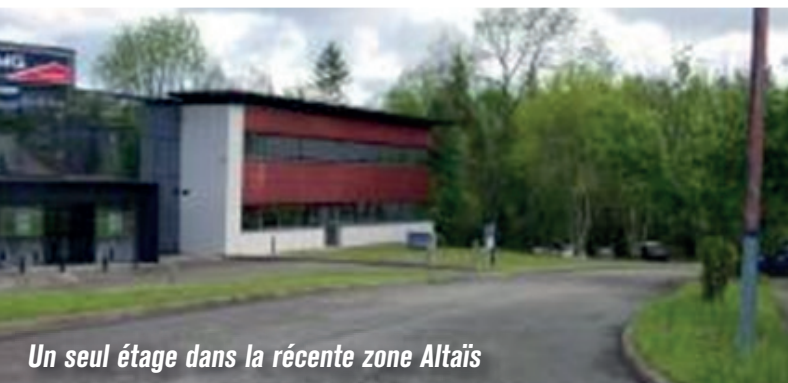
Un seul étage dans la récente zone Altaïs