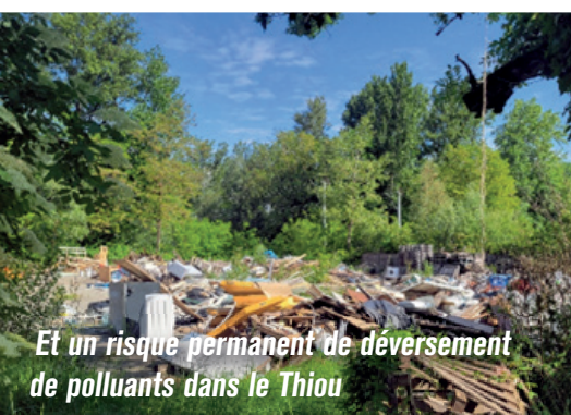
Et un risque permanent de déversement de polluants dans le Thiou