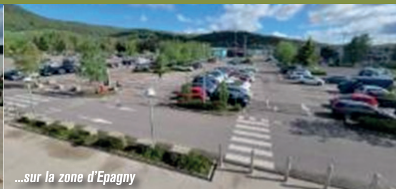
...sur la zone d'Epagny

Il est tout à fait possible de donner un avenir à l'industrie et à l'artisanat dans le Grand Anancy en optimisant les 770 hectares de zones d'activités existantes.