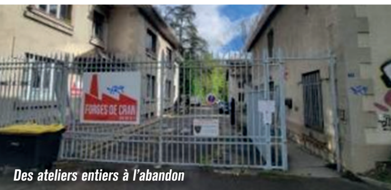
Des ateliers entiers à l'abandon

8 hectares à réhabiliter aux Forges de Cran