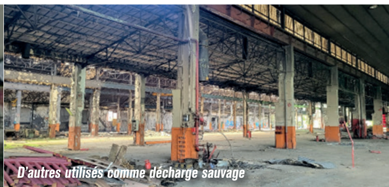
D'autres utilisés comme décharge sauvage