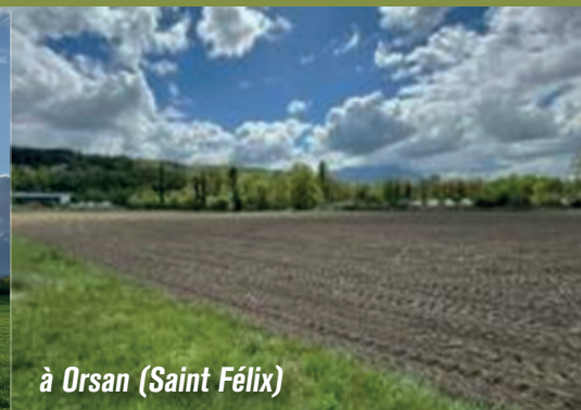
à Orsan (Saint Félix)