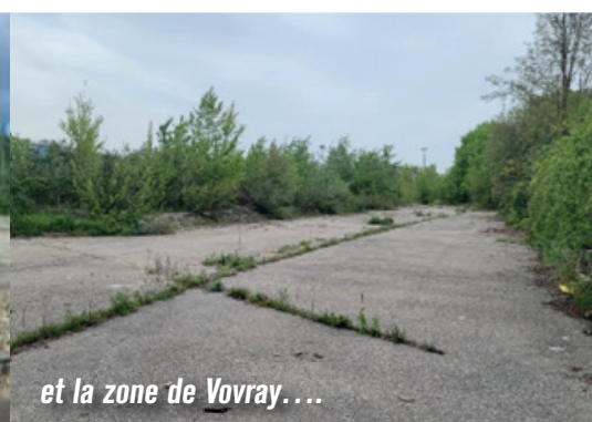
et la zone de Vovray...